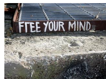
William Ross - Flickr

En amont et en aval se situe une nécessaire prise de conscience : pour pouvoir mener à bien des projets d'interculturalité, il est nécessaire d'avoir une prise de conscience des enjeux, des besoins, de ses propres motivations, déterminismes et préjugés. Cette prise de conscience est amenée par un esprit ouvert, qui s'informe, qui s'enrichit d'expériences multiples et complexes, par les discussions, les remises en question et l'esprit critique. Elle s'acquiert avant d'entamer un projet, pendant sa conception, au fil des rencontres et des débats, et lors de sa concrétisation.